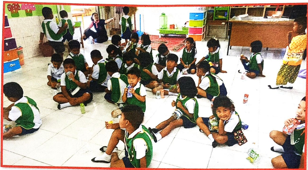
ร่วมรับประทานอาหารว่างและอาหารกลางวัน