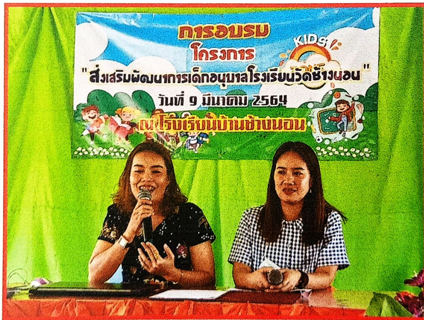
นายกอกการบริหารส่วนตำบลลำภี กล่าวเปิดงาน