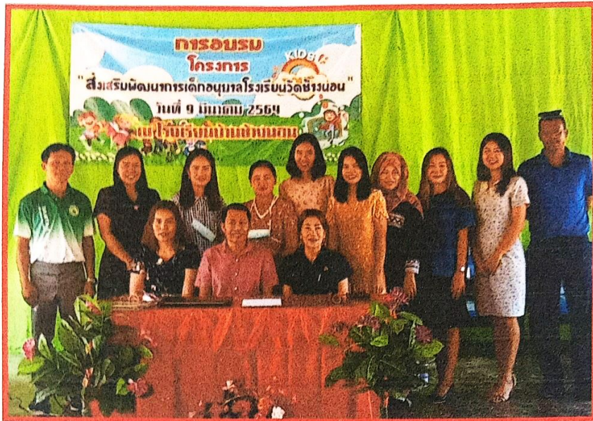
ภาพถ่ายนายกฯ วิทยากร คณะครู