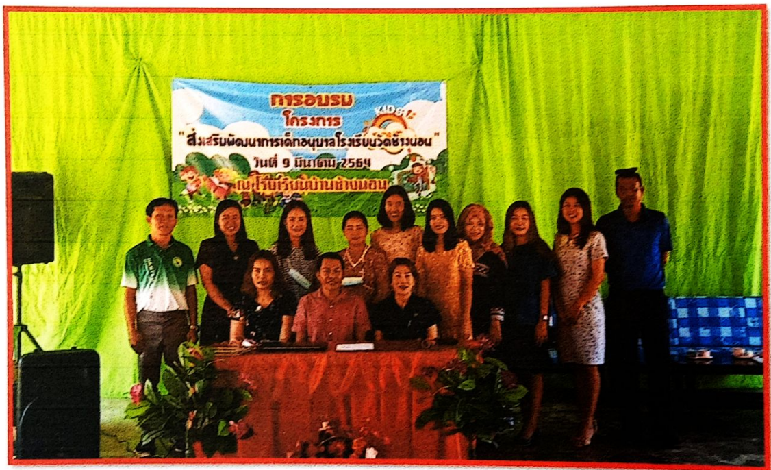
ภาพถ่ายผู้ร่วมเข้าร่วมอบรมโครงการ