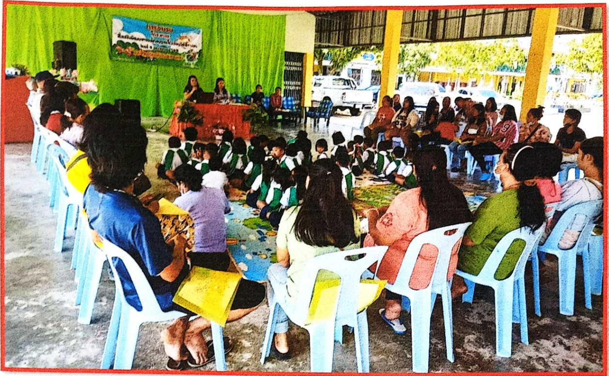
รับฟังการถ่ายทอดความรู้จากวิทยากร