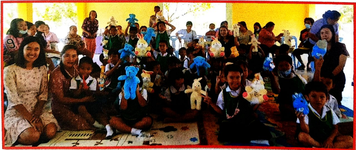
เด็กๆรับรางวัลจากวิทยากร