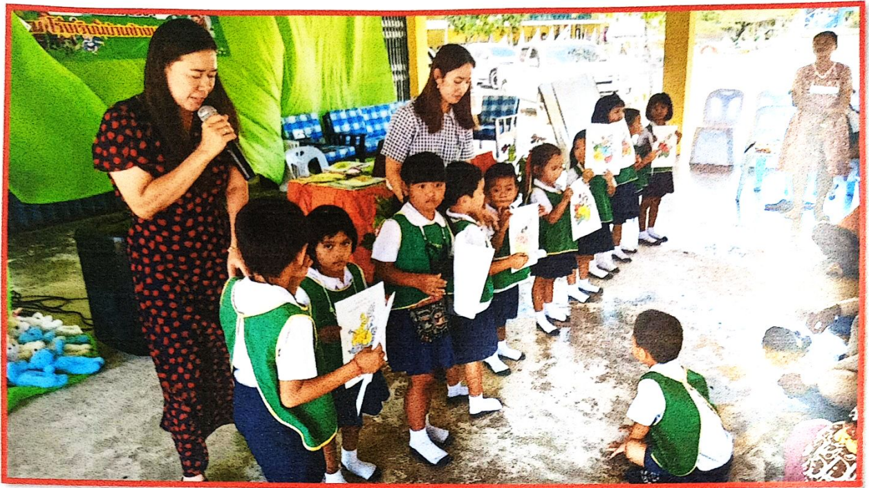
นักเรียนและผู้ปกครองทำกิจกรรมร่วมกัน