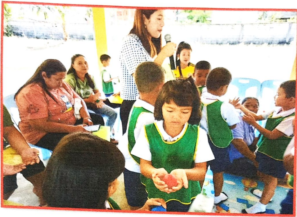
นักเรียนและผู้ปกครองทำกิจกรรมร่วมกัน