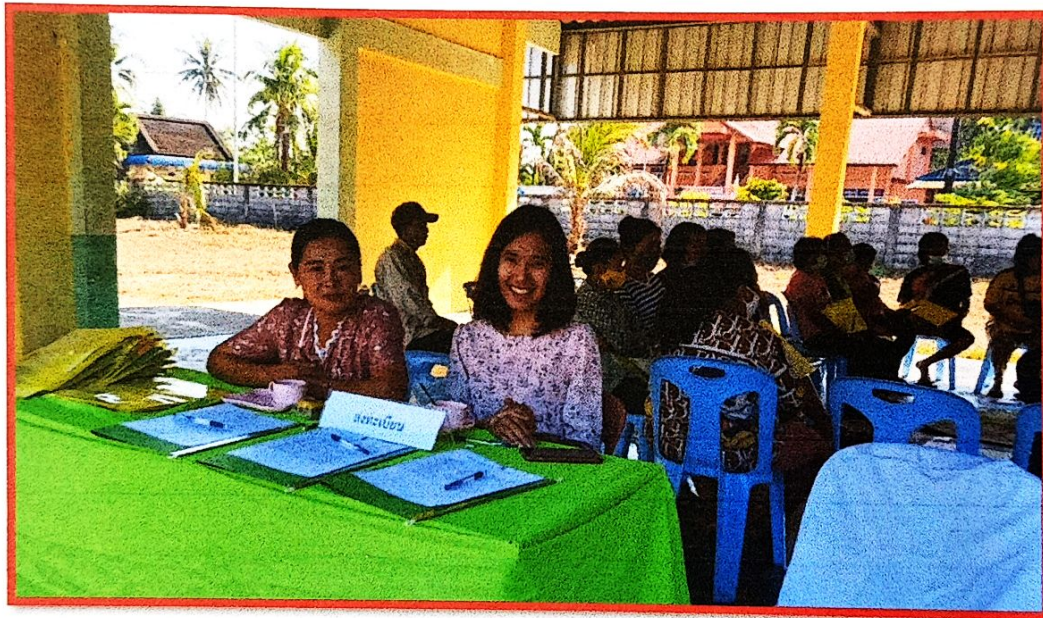
รับลงทะเบียนเข้าร่วมโครงการส่งเสริมพัฒนาการเด็กอนุบาลโรงเรียนวัดช้างนอน