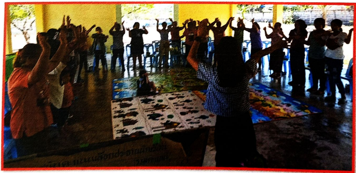
ผู้ปกครองร่วมกิจกรรมกับวิทยากร